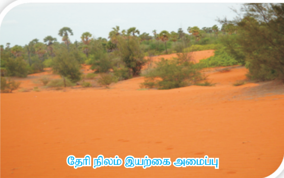
தேரி நிலம் இயற்கை அமைப்பு

பனை மரம், வேம்பு, தைலமரம், நில வேம்பு, வாகை, சீமைக்கருவேல், உடை, புங்கம், புளி, சவுக்கு, கேஸியா, முந்திரி போன்ற மரங்களும், விராலி, நொச்சி, நில ஆவாரை, துத்தி, காட்டாமணக்கு, கிளுவை, கொழுஞ்சி, நன்னாரி, தக்கைப்பூண்டு போன்ற புதர்ச் செடிகளும், அருகு, கோரை போன்ற இதர புல் வகைகளையும் சேர்த்து சுமார் 2000 வகையான தாவர இனங்களைக் கொண்ட வனப்பகுதியாகும்.