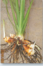
நாற்றுநட்ட 2-ம் மாதம்