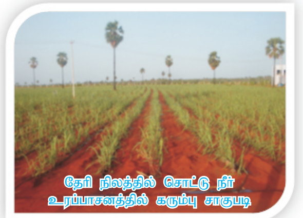
தேரி நிலத்தில் சொட்டு நீர் உரப்பாசனத்தில் கரும்பு சாகுபடி

சாதாரண நீர்ப்பாசனத்தில் கரும்புப் பயிரிடுவதற்கு சுமார் 3000 மி.மீ. தண்ணீர் தேவைப்படும். ஆனால், சொட்டு நீர்ப்பாசனம் பயன்படுத்துவதன் மூலம் தண்ணீரின் தேவையை 50-60 சதம் சேமிக்க முடியும். மேலும், இது மணற்பாங்கான தேரி நிலத்திற்கு ஏற்ற சிறந்த தொழில் நுட்பமாகும்.