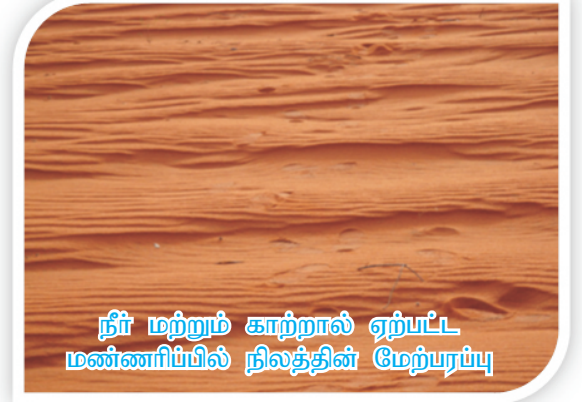
நீர் மற்றும் காற்றால் ஏற்பட்ட மண்ணரிப்பில் நிலத்தின் மேற்பரப்பு