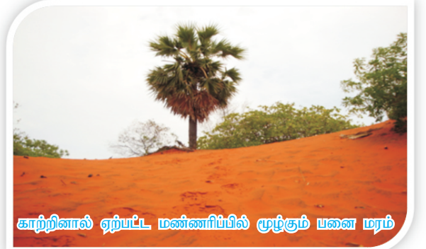
காற்றினால் ஏற்பட்ட மண்ணரிப்பில் முழுகும் பனை மரம்