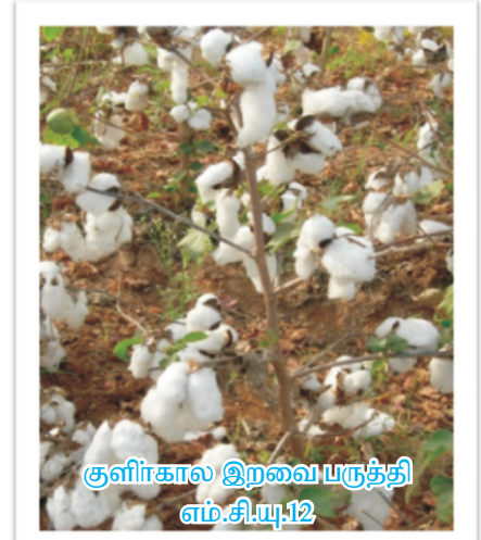
குளிகால இறவை பருத்தி எம்.சி.யு.12

தமிழ்நாடு வேளாண்மைப் பல்கலைக் கழகத்தால் வெளியிடப்பட்ட எம்.சி.யு.12, எம்.சி.யு.13 இரகம் எக்டருக்கு சராசரியாக 20 குவிண்டால் விளைச்சல் தருகின்றது. இதன் இழைகள் 50-ஆம் நம்பர் நூல் நூற்க தகுதியுடையது. பூச்சி நோய் தாக்காத தன்மையும் கொண்டது. டி.சி.எச்.பி. 213 வீரிய ஒட்டு இரகம் 40 குவிண்டால் வரை விளைச்சல் தரவல்லது. இதன் இழைகள் 100-ஆம்