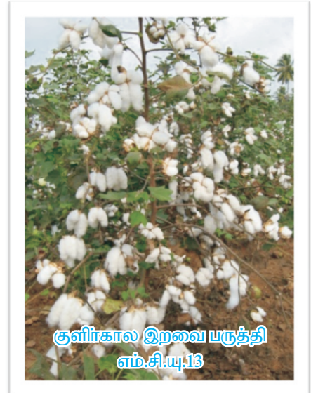
குளிகால இறவை பருத்தி எம்.சி.யு.13