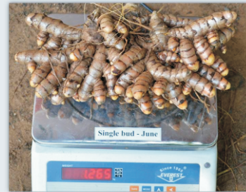
ஒரு நாற்றின் கிழங்கு மகசூல்