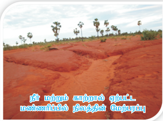
நீர் மற்றும் காற்றால் ஏற்பட்ட மண்ணரிப்பில் நிலத்தின் மேற்பரப்பு

கரும்பு (சக்காரம் அபிஸ்ஸனநாலிஸ்) என்ற தாவரவியில் பெயர் கொண்டதாகும். பல்வேறு உபயோகப்பொருட்களைக் கொடுக்கக்கூடிய முக்கிய பயிராகும். இந்தியாவில் கரும்பு சுமார் 5.3 மில்லியன் எக்டர் பரப்பளவில் பயிரிடப்பட்டு சுமார் 380 மில்லியன் டன்கள் கரும்பு உற்பத்தி செய்யப்படுகின்றது. இவற்றிலிருந்து சுமார் 27 மில்லியன் டன்கள் சர்க்கரை உற்பத்தி செய்யப்படுகின்றது. தமிழ்நாட்டில் சுமார் 3.5