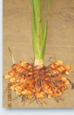
நாற்றுநட்ட 5-ம் மாதம்